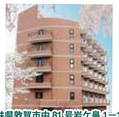
敦賀駅より車で10分・敦賀ICより5分 福井県敦賀市中81号岩ヶ鼻1-1